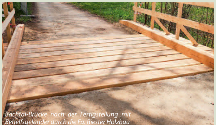
Bachtal-Brücke nach der Fertigstellung mit Behelfsgeländer durch die Fa. Riester Holzbau