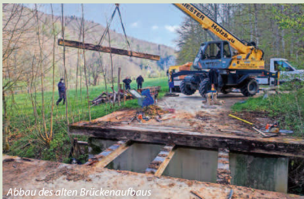
Abbau des alten Brückenaufbaus

Nach den Sommerferien soll der Donauradwanderweg dann auf den Gemarkungen Mühlheim, Fridingen und Buchheim grundlegend verbessert werden.